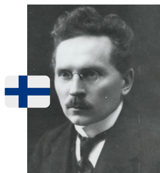
Lauri um sūomli.